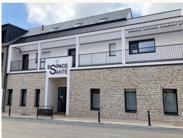
Vue extérieure de l'espace santé

Ce projet d'espace santé répond aux attentes des professionnels de santé car il permet un parcours de soin efficace grâce à une communication facilitée entre professionnels.