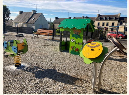
Aire de jeux en cours de travaux