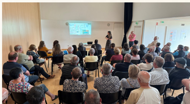
La réunion publique participative du 24 juin dernier qui a réuni 46 personnes

Quand le foncier constructible est rare et la mixité des usages fait sens : le projet, qui comprend du résidentiel, des commerces et des services, vise à créer un lieu de vie et d'échanges où tout est à portée de main.