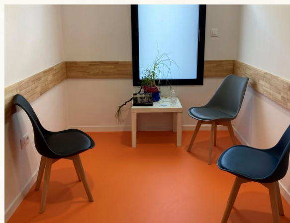
Salle d'attente des cabinets infirmiers et de l'ostéopathe